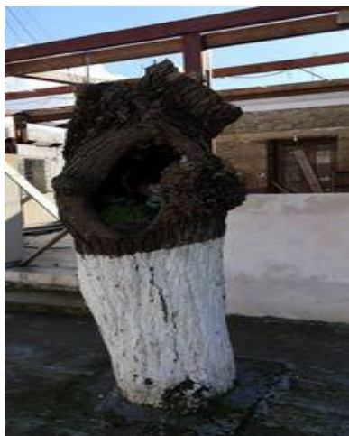
ΔΕΝΔΡΟ ΣΤΟ ΠΕΖΟΔΡΟΜΙΟ ΔΙΠΛΑ ΣΤΟ ΚΟΙΝΟΤΙΚΟ ΚΑΤΑΣΤΗΜΑ (1)