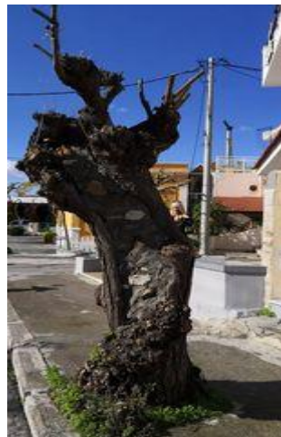
ΔΕΝΔΡΟ ΣΤΟ ΠΕΖΟΔΡΟΜΙΟ ΑΠΕΝΑΝΤΙ ΑΠΟ ΤΟ ΚΟΙΝΟΤΙΚΟ ΚΑΤΑΣΤΗΜΑ