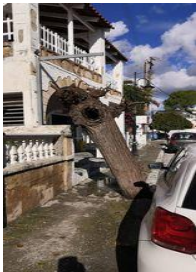
ΔΕΝΔΡΟ ΣΤΗΝ ΟΙΚΙΑ ΦΡΑΓΚΟΥ (1)