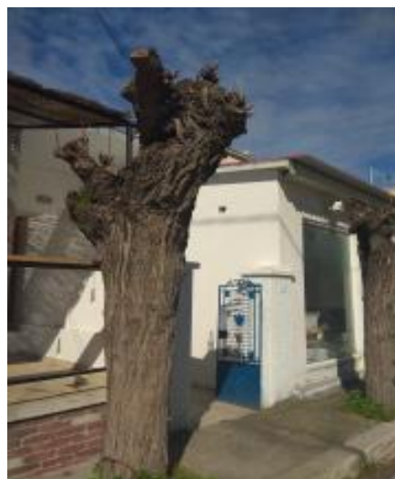
ΔΕΝΔΡΟ ΣΤΟ ΚΑΤΑΣΤΗΜΑ ΕΥΑΓΓΕΛΙΔΗ (2)