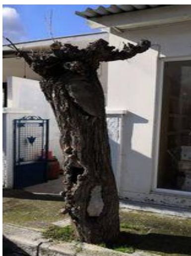
ΔΕΝΔΡΟ ΣΤΟ ΚΑΤΑΣΤΗΜΑ ΕΥΑΓΓΕΛΙΔΗ (1)