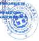
Σχέδιο 3 από 2