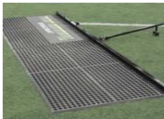
Εικ.2 Τυπικός ελκόμενος τάπητας

Η εκπαίδευση στην χρήση του εξοπλισμού περιλαμβάνεται ανηγμένα στις τιμές της σύμβασης.