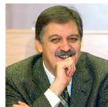
Πάπης Κουκουλιόπουλος Πρόεδρος της ΚΕΔΚΕ