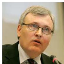
Anders Knape Πρόεδρος της ομάδας εργασίας του CEMR για τις αδελφοποιήσεις

Ο Δήμος Ροδίων με χαρά φιλοξενεί το συνέδριο “Αδελφοποίηση για τον κόσμο του αύριο”, από τις 10 έως τις 12 Μαΐου 2007.