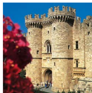
Η Καταληκτική Συνεδρία θα διεξαχθεί στο Παλάτι του Μεγάλου Μαγίστρου.

Η Ρόδος έχει καταφέρει να συνδυάσει την ιστορία και τον πολυπολιτισμικό χαρακτήρα της με τη σύγχρονη υποδομή στο αστικό της κέντρο και να αναδειχθεί σε έναν από τους σημαντικότερους τουριστικούς και συνεδριακούς προορισμούς της Ελλάδας, έχοντας φιλοξενήσει πολύ σημαντικά γεγονότα, όπως τη Σύνοδο Κορυφής της ΕΕ το 1988.